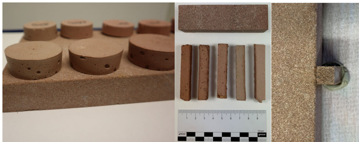
Abb. 2: Proben mit unterschiedlichen Gehalten an rotem Eisenoxid-Pigment auf bzw. neben Bebertaler Sandstein (links, mitte) und gebrochene Probe neben Bebertaler Sandstein (rechts)